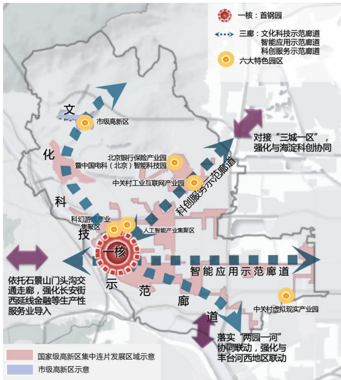
图1 “一核三廊六大特色园区”发展格局

部委、高校科研院所、龙头企业等相关创新资源，主动融入“主导+特色+未来”现代化产业体系，与东中部创新主体形成“前店后厂”联动发展格局。