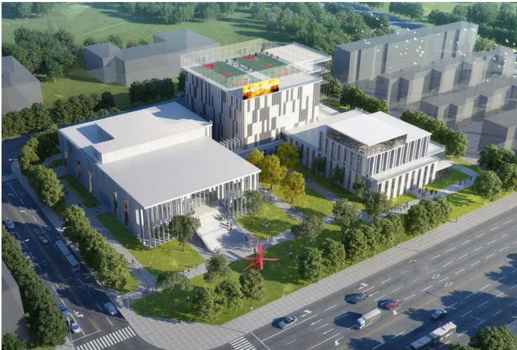
图 7 百善镇综合文化中心效果图

百善镇综合文化中心项目位于镇中心区西部地块内，规划用地性质为文化设施用地，建设规模 5460 平方米，项目计划投资约 4800 万元，全部由财政资金支持。拟将 1.45 公顷建设用地规划为地上综合文化中心、体育馆（风雨操场）、青少年宫、图书馆四个功能，地下整体为停车场的组团式建筑形式，目前规划方案初步通过规自分局审核。下一步，将开展多规合一协同平台初审申报工作，“十四五”期间将逐步分阶段建设并投入使用。