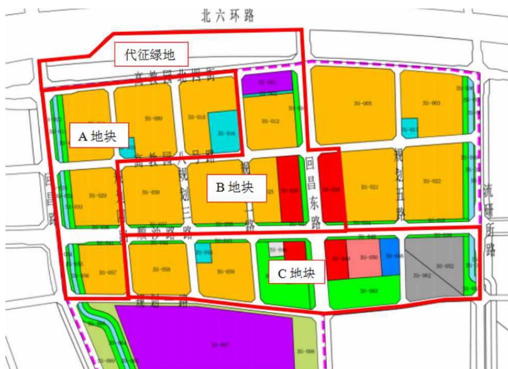
图 3 百善镇中心区西部地块土地一级开发项目示意图

百善镇中心区西部地块土地一级开发项目规划总用地面积约 102.76 公顷，规划建筑规模约 71.77 万平方米，共分 A、B、C 三个地块，其中 A 地块 33.59 公顷、建筑面积 27.32 万平方米，B 地块 34.57 公顷、建筑面积 25.28 万平方米，C 地块 34.6 公顷、建筑面积 19.17 万平方米。“十三五”期间，已取得控规批复、授权批复。“十四五”期间，将积极协调昌房公司就一级开发地块空管高度与沙河机场进行对接，同时积极协商增减挂事宜，平衡耕地指标，加快推动一级开发地块建设成型。