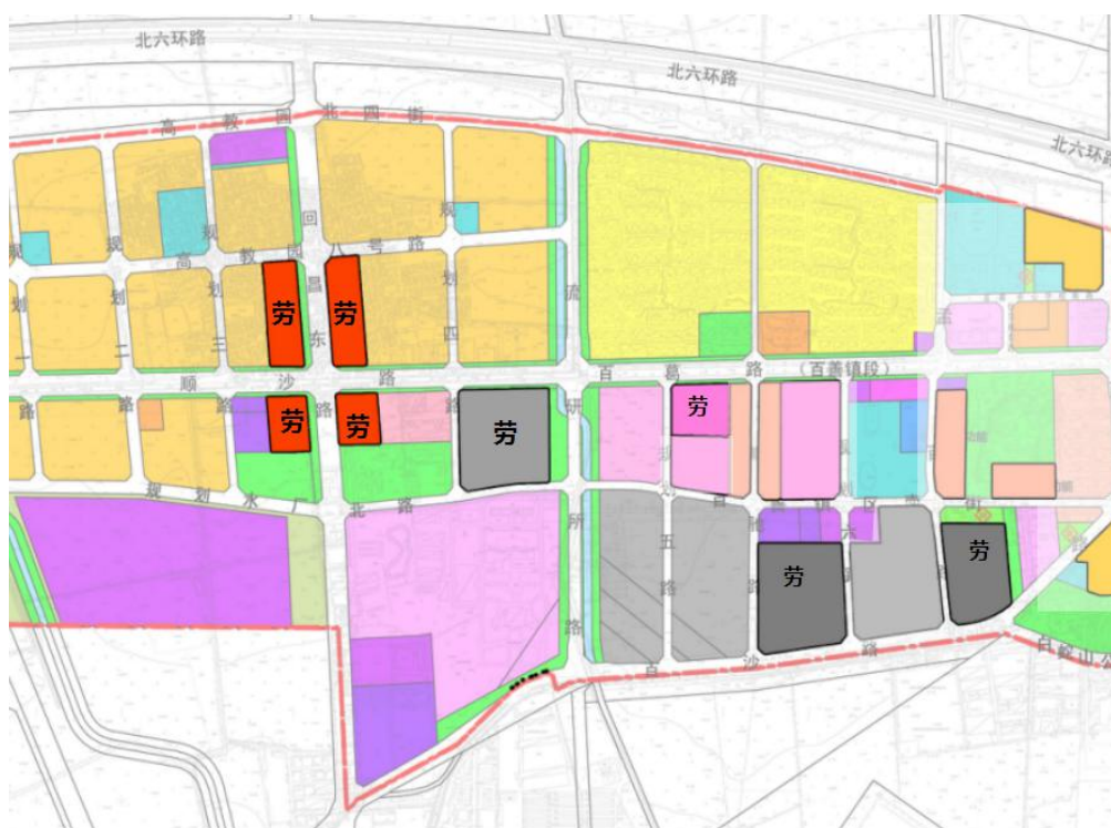
图 5 百善镇四村劳动力安置用地项目示意图

百善镇四村劳动力安置用地项目涉及百善、牛房圈、二德庄、东沙屯四个村，占地 21.1 万平方米，建筑面积 22.83 万平方米，全部地块已实现场清地净。“十四五”期间，将在街区单元规划编制时，探索地块集中整理可行性，按照类园区规模，探索形成产业集聚规模效应。同时精准匹配项目，将劳安地块纳入昌平高精尖产业企业项目储备用地，聚焦打造科技创新综合体，对接高教园区产学研合作研究基地、科技创新联合体等科教融合平台落地，引进优质资源和企业负责全额投资、建设和运维，拓展村集体经济发展新路径。