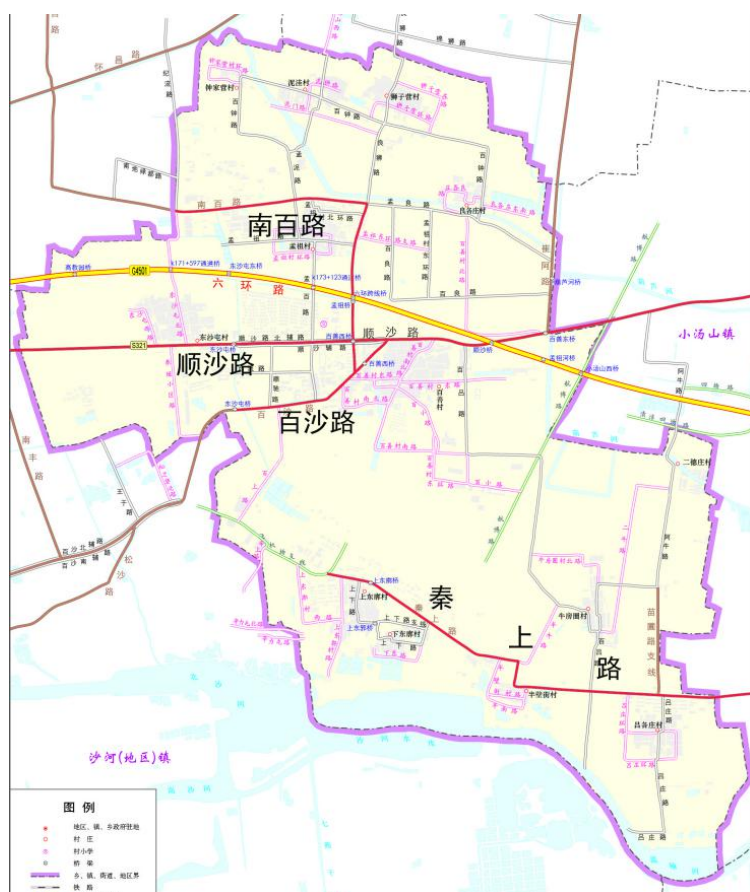
图 8 百善镇重点道路工程项目示意图

“十四五”期间，将积极推动镇域内道路大修工程。其中，顺沙路大修工程总长度 1600 米，规划宽度 50 米，计划投资 1200 万元；南百路大修工程为顺沙路至东沙屯北路路段，总长度 5300 米，计划投资 3180 万元；百沙路大修工程总长度 3159.6 米，规划红线宽度 30-40 米，计划投资 15046 万元；秦上路大修工程路段为沙河机场至吕各庄村东路段，总长度 4600 米，计划投资 2760 万元。