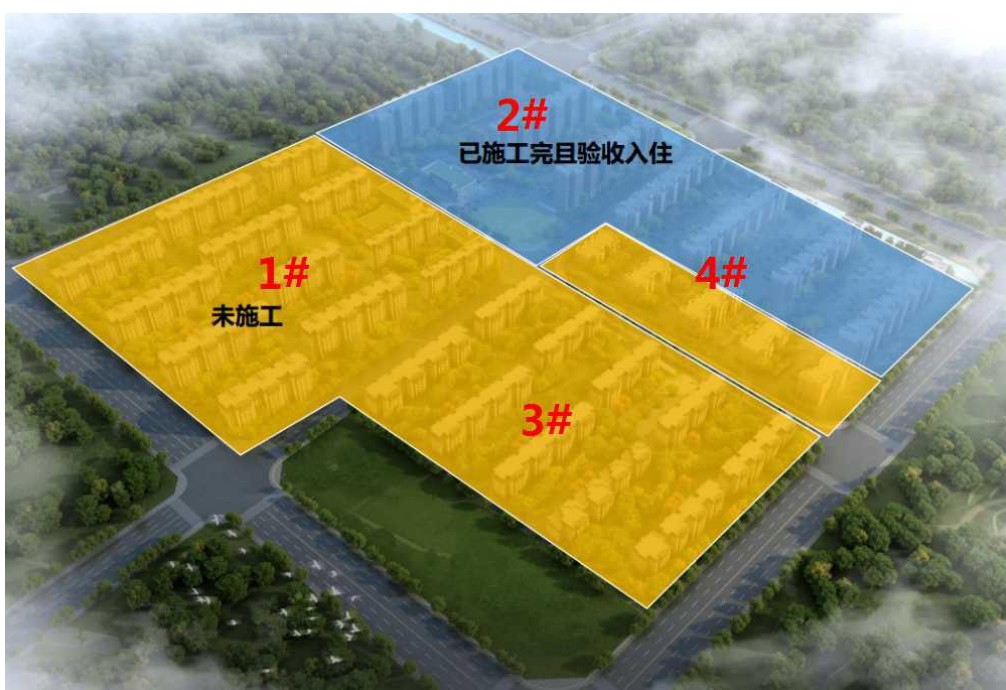
图 2 阿苏卫定向安置房项目（百善镇部分）布局图

阿苏卫循环经济产业园周边村庄搬迁重点项目（百善镇部分）定向安置房地块位于东沙屯村，定向安置房项目共分为 1#、2#、3#、4#四个地块，总用地面积 24.58 万平方米，总建筑面积 75.65 万平方米，拟安置牛房圈、二德庄、百善、东沙屯四村 2086 户 8753 人，目前 2#地块全部及 4#地块局部共计 27.98 万平方米安置房建成投用，3586 人回迁上楼。“十四五”期间，将完成剩余安置房建设及剩余村民回迁上楼工作。