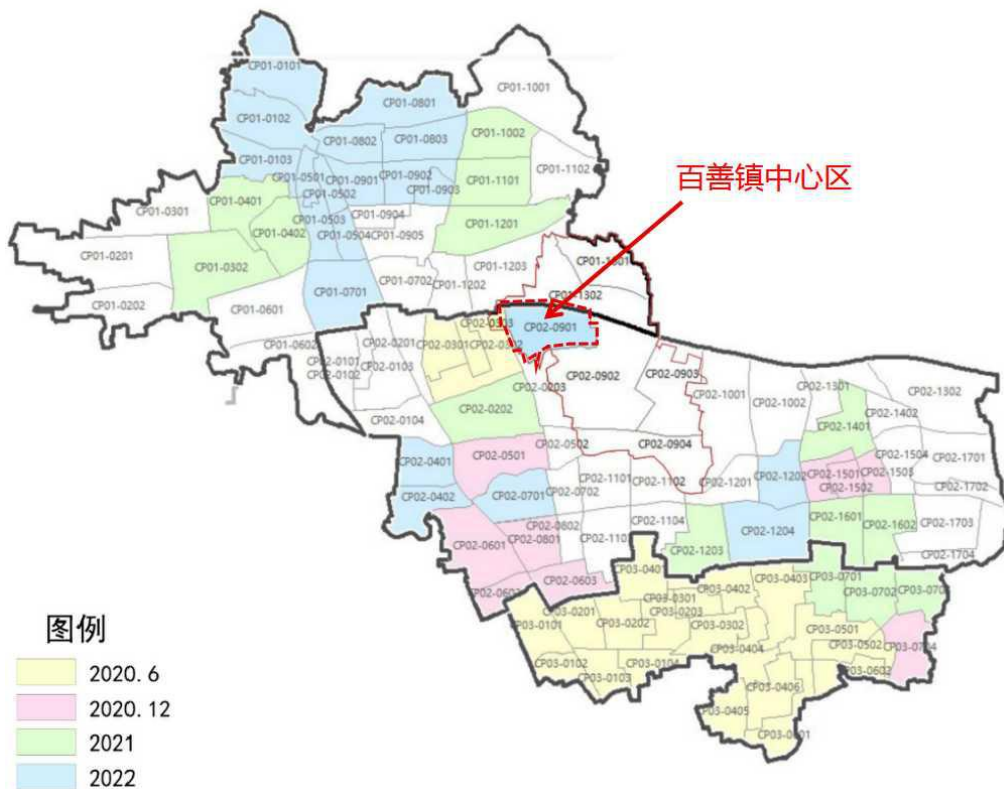
图 1 未来科学城控规编制图, 2022 年编制百善镇中心区

前启动镇中心区规划单元编制(编号 CP02-0901 街区), 聚焦“用地整合、功能组合”, 探索集体产业地块整合可行性, 按照类园区规划产业集群, 同时沿顺沙路布局集体产业、人才保障和公服设施, 稳定规划实施路径。