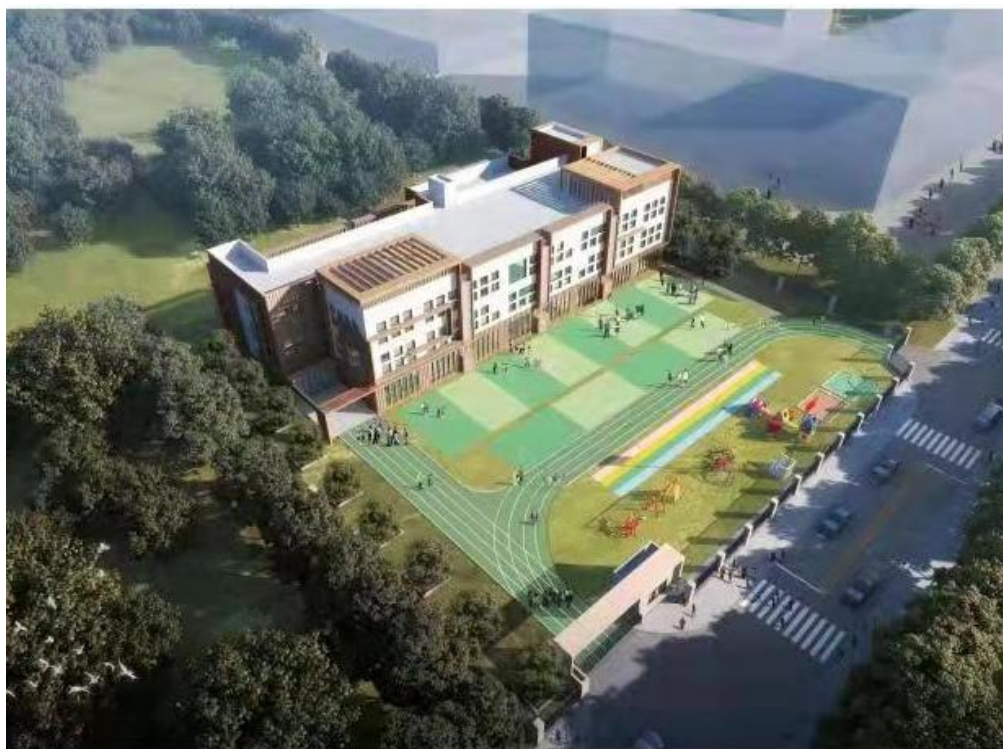
图 6 百善镇中心幼儿园效果图

百善镇中心幼儿园项目位于百善学校东侧，项目主体为昌平区教委，建成后将成为区教委下属全额拨款事业单位性质的幼儿园。幼儿园规划为 12 个标准教学班以及相关的配套用房，总用地面积 5329 平方米，其中建设用地面积 4800 平方米，总建筑面积为 4713 平方米。项目正在办理《项目建议书代可行性研究报告》，目前正在开展专家评审，同时正在办理征地结案和规划方案的审核工作，力促项目 2021 年开工，“十四五”期间将建成使用。